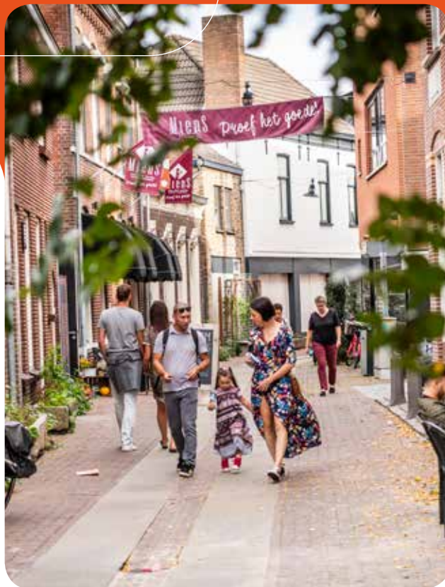
Een van de gezellige aanloopstraten

€ 71.332,-. In 2017 werd voor projecten een netto bedrag van € 80.517,- uitgegeven.