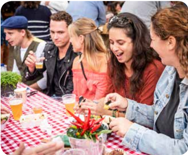
..en de genietende gasten

Vanuit de Werkplaats Stadshart Oss is sinds 2018 het zogenoemde Makelpunt actief. Een overleg tussen makelaars, vastgoedeigenaren, CMO en de gemeente Oss. Vanuit het Makelpunt brengen we vragers en aanbieders van leegstaande panden bij elkaar. Door bijvoorbeeld verplaatsing van kansrijke retail of horeca buiten het compacte centrum naar het stadshart bestrijden we leegstand. Op de achterblijvende locatie is vaak nieuwe woningbouw of andere bedrijvigheid mogelijk. Het aantrekken van nieuwe