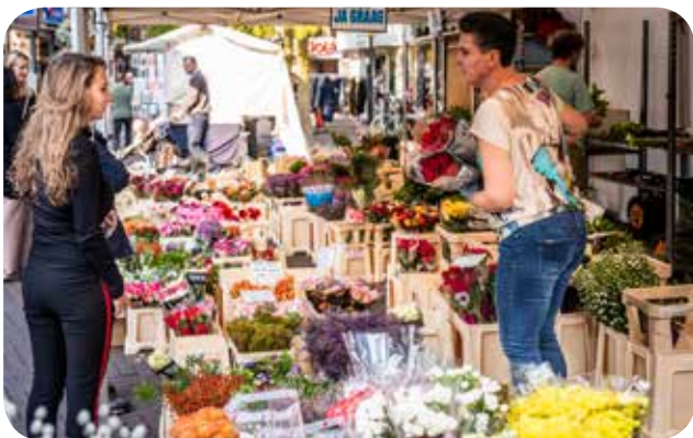
Zeg het met bloemen

Na eerdere studies door de gemeente Oss naar de haalbaarheid van een versmarkt in het centrum bleek dat een brug te ver. Binnen het CMO is het idee van een kleinschalige versmarkt niet weggeveest. Er werd contact gezocht en onderhouden met de Maasmeanders en contact voor begeleiding en het uitwerken van een concept gezocht met het Marktteamcentrum van de Rabobank Oss-Bernheze. Samen met een vertegenwoordiger van de Maasmeanders werd in 2018 een bezoek gebracht aan Oirschot om daar te worden geïnformeerd over het succesvolle initiatief 't Bint. Daarna werd het concept Mijnstreekwinkel, dat gebaseerd is op het aanbod van lokale (vers)producten, door het CMO verwerkt in een presentatie. Tijdens de ALV van de Maasmeanders op 22 oktober 2018 presenteerde de centrummanager het concept. In 2019 wordt hieraan een vervolg gegeven.