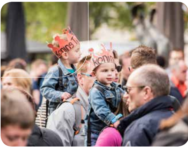
Koningsdag 2018 druk bezocht

de Heuvel en de grote zandbak op het Walplein. De uitgaven voor dit extra entertainment bedroegen € 15.581,-.