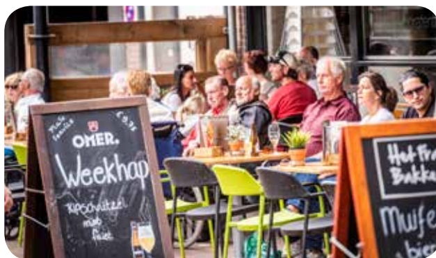
Een van de gezellige terrassen in het centrum

In 2018 werd met stakeholders een aangepaste organisatiestructuur uitgewerkt om nog meer draagvlak te krijgen bij andere belangrijke centrumpartners zoals (nieuwe) vastgoedeigenaren. De volledige implementatie van de nieuwe structuur wordt medio 2019 verwacht. De winkeliersvereniging COO, actief via haar afgevaardigden in het bestuur van het CMO, heeft door een sterk teruglopend ledenaantal in 2018 besloten om de contributie per 1 januari 2019 volledig af te schaffen om met deze stap alle winkeliers automatisch lid te maken. Dit werd tijdens de ALV op 16 oktober 2018 in de Groene Engel aan de aanwezige centrumondernemers gepresenteerd.