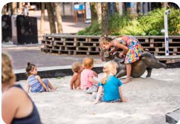
Varkentje blijft leuk

In de begroting van 2018 werd voor projecten een netto bedrag van € 81.750,- opgenomen. Dit is inclusief de lease van € 23.500,- voor sfeerverlichting. De werkelijke uitgaven voor sfeerverlichting, sfeerevenementen, graffitiwijdering, hanging baskets en leegstandsbestrijding bedroegen bruto € 84.602,-. Na aftrek van bijdragen waren de netto uitgaven