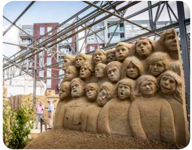
Laatste editie zandsculpturen festival

menten die door derden werden georganiseerd: Rockronde, Her & Der, Babs Festival, Dag van de Techniek, Oss On Classic Wheels, De Osse Nacht, Zandsculpturen Festival Brabant en Winterland